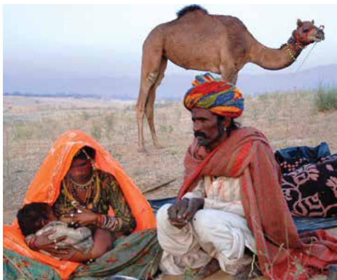
Chandan Dey© WABA 2008