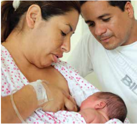
Jose Antonio © WABA 2013