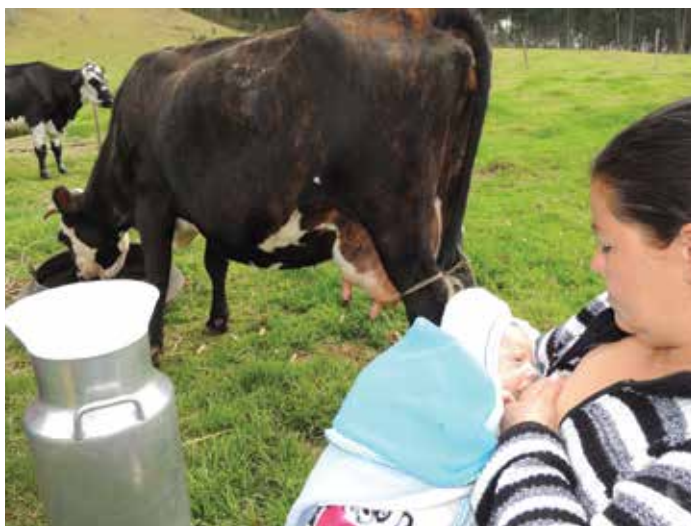
Jaime © WBW 2015